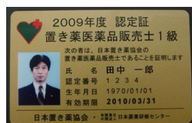
カード型認定証（1級、年次用）