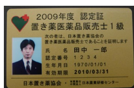
カード型認定証（1級、年次用）