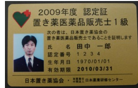
カード型認定証（1級、年次用）