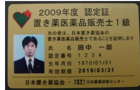
カード型認定証（1級、年次用）