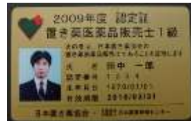
カード型認定証（1級、年次用）